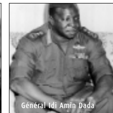
Général Idi Amin Dada